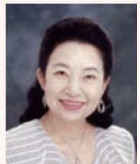
山崎陽子 童話作家・ミュージカル脚本家