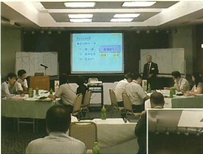
於 アルカディア市ヶ谷

※ 写真は令和元年度開催のもので、 本年度の開催ではマスク着用、参加者間の 距離を取る等、新型コロナウイルス感染 予防対策を徹底して実施します。