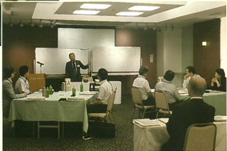
於 アルカディア市ヶ谷

※ 写真は令和元年度開催のもので、 本年度の開催ではマスク着用、参加者間の 距離を取る等、新型コロナウイルス感染 予防対策を徹底して実施します。