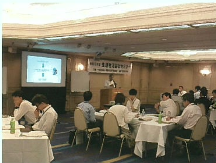
会場名 東京ガーデンパレス

※ 写真は令和元年度開催のものです。 本年度の開催ではマスク着用、参加者間の距離を取る等、新型コロナウイルス感染予防対策を徹底して実施します。