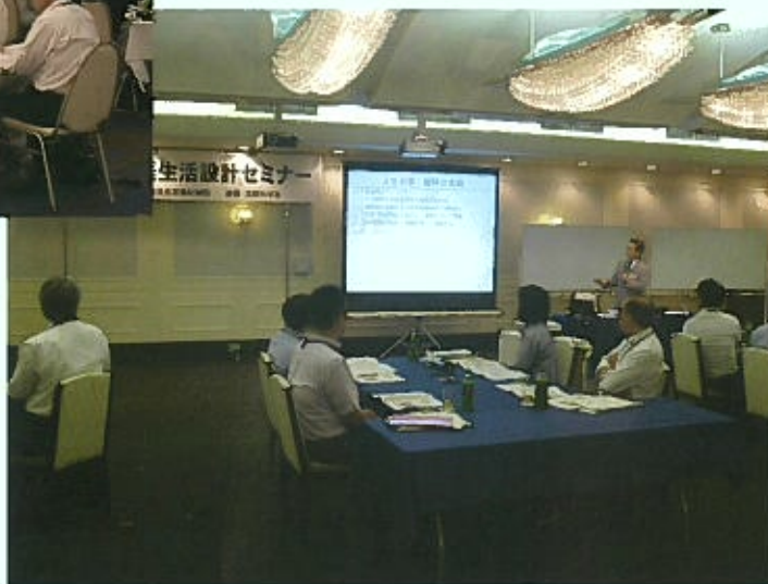
会場名 京都ガーデンパレス

※ 写真は令和元年度開催のものです。 本年度の開催ではマスク着用、参加者間の距離を取る等、新型コロナウイルス感染予防対策を徹底して実施します。